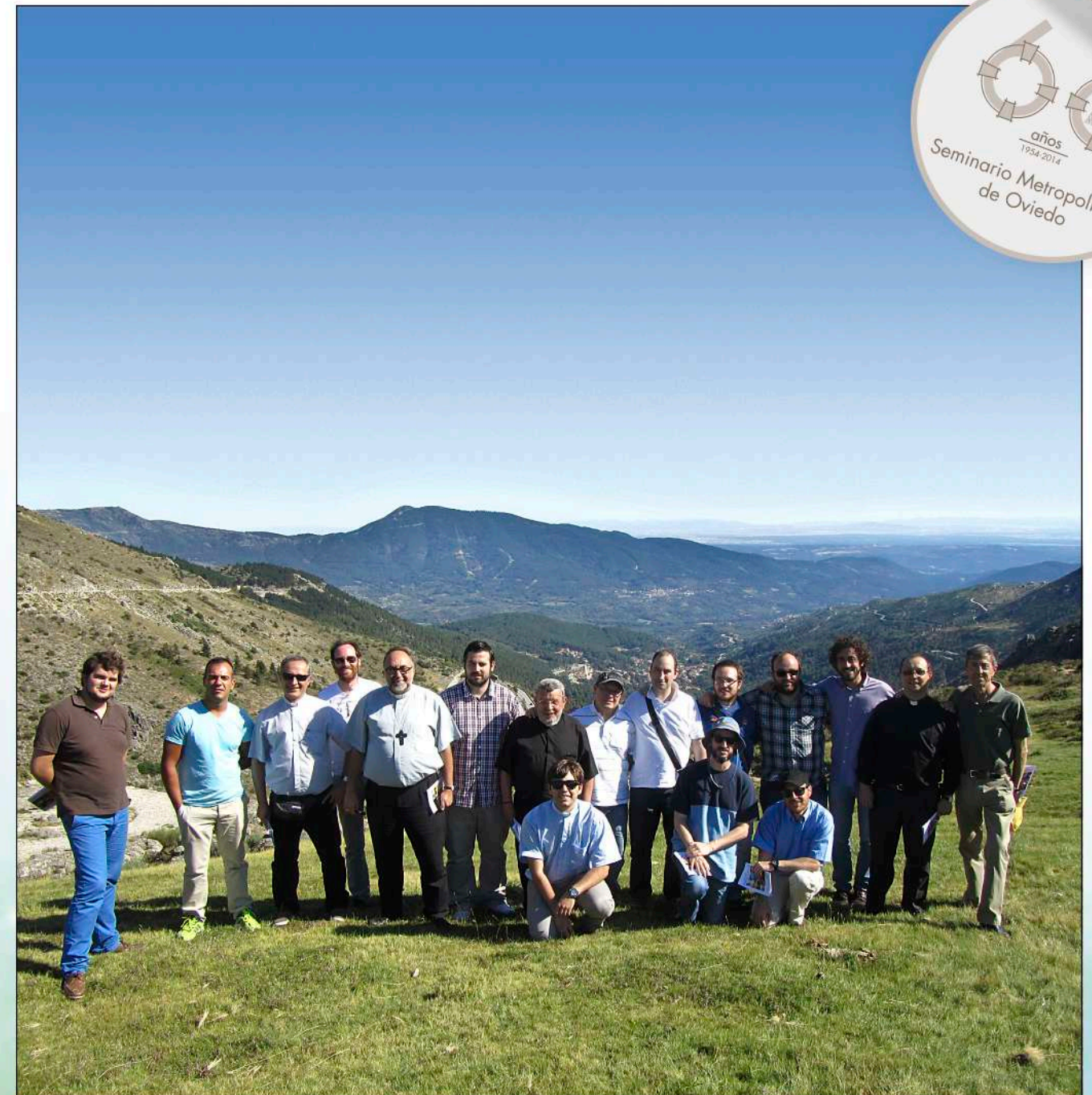
El Seminario Metropolitano con el Sr. Arzobispo camino de Arenas de San Pedro.